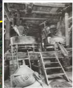
Mulino Di Sotto Sigala