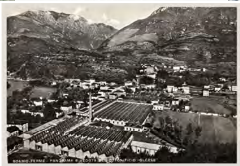
Ex Olcese ora Centro Congressi