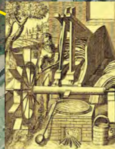
Gualchiera - Follo