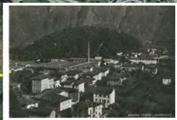
Zona Antica Segheria Vela