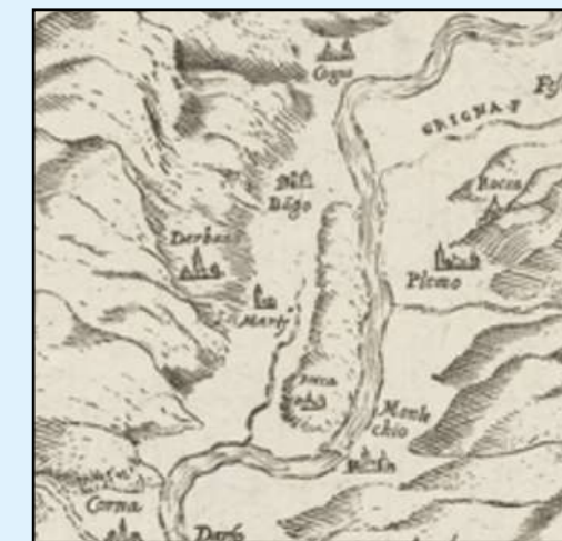
Leone Pallavicino 1597